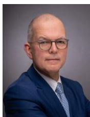
Dr. Hans-Jörg Naumer Director Global Capital Markets & Thematic Research

proporcionando apoyo a la economía del bloque. A largo plazo, unos niveles más altos de inversión en Europa podrían ayudar a reducir su dependencia de las exportaciones. Sin embargo, siguen existiendo riesgos, en particular la crisis presupuestaria en Francia y el actual estancamiento político en Estados Unidos.